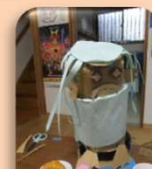
アマビエちゃん作り