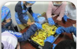
手作りおやつ「大学芋」