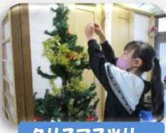
クリスマスツリー