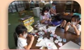
ビーズフレズレット作り