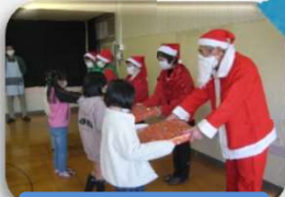
サンタクロース来訪