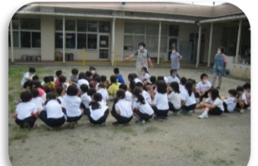
避難についての話を 聞きました。