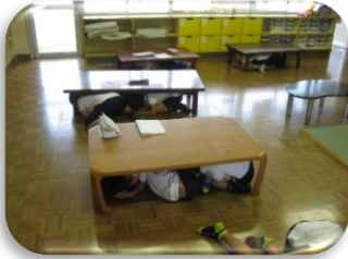
『地震が発生しました！』 警報です。机の下に隠れて!!

9月1日は防災の日です。 学童部では毎年2回、地震と火災を想定して避難訓練をおこなっています。