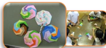
折紙でペロペロキャンディを 作ります