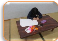
ハロウィンのイラストを描いています♪