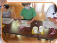
レッツでメモボードを作り それぞれ自分専用に 仕上げます♪