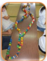
なが〜いドミノです♪ 全部たおれるかな？