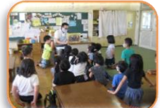
紙芝居みんな集中してます。