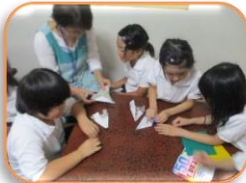
ハロウィンカボチャを 折紙で作ります