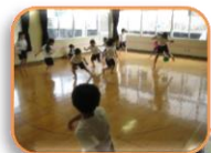
遊戯室を使った 後は雑巾かけ