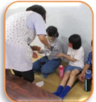
おやつの前には 消毒です