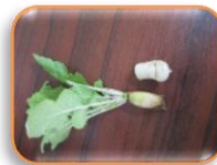
野菜を収穫しました かわいいですね♪