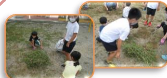
草引きの後は外で いっぱい遊びます♪