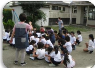
並び終わったら人数確認 みんな揃っているかな。