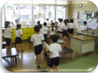
地震がおさまりました。 慌てず園庭に出るよ。