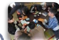
絵馬を作って 願いが叶いますように