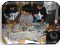
スライム めっちゃ伸び～