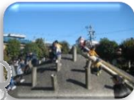
すべり台、 すべるぞー