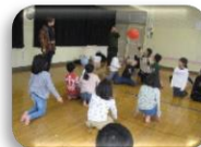
風船バレーで みんなで対決だ！