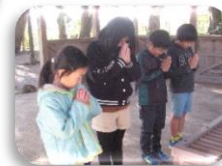
今年も良い年 になりますように...