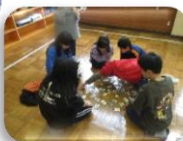
児童館にて 新春かるた大会