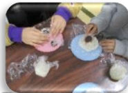
おはぎ作り 楽しいな♪