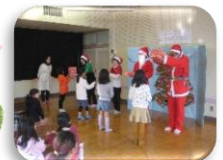
民生委員の皆さんと ケーキを食べ楽しい時間を 過ごしました。 ありがとうございます♪