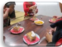
ケーキ作り、 かわいく できるかな？