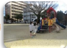
公園でおいかけっこ