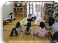
次はどこかな？ 2人ともがんばれー