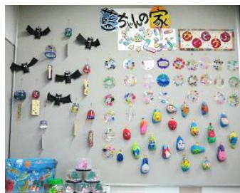
壁面にお面等のかわいい かざりがいっぱい！

城田郵便局に子ども達の作品が展示されました♪ 11月15日(火)～11月24日(木)の展示となっておりますので、ぜひ足をお運びください☆