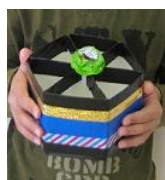
牛乳パックが自分だけの ペン立てに大変身☆