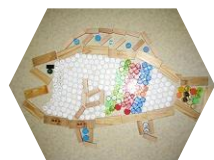
ペットボトルのキャップや かまぼこ板を上手に並べて 大きな力二や魚の完成☆ 全長はなんと120cmです！