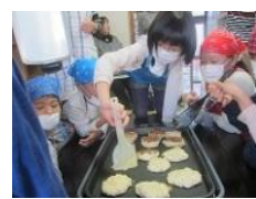
プレートの上で、形を 整えながら焼きました おいしそうな焦げ目が ついています！