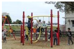
子どもは風の子！ 天気の良い日は外で 遊びます