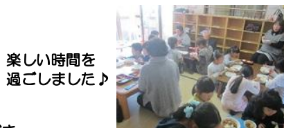
楽しい時間を 過ごしました♪