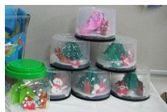
ドームの中にはすてきなツリーやゆきだるまが…。