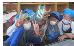
運営委員会の方にきていただき、 昼食やバナナパンケーキを一緒に 食べたりしました☆