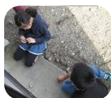
なかなか穴が 開かない！