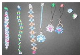
ビーズを使ったアクセサリー作りが流行っています カラフルなビーズの組み合わせがとってもきれい！