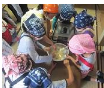
皆でフォークを使って 上手に混ぜることが できました！